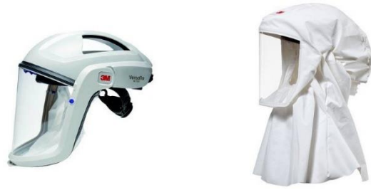
Atemschutzhelm/-haube + Schutzanzug