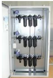
CLEAN-AIR feste Installation